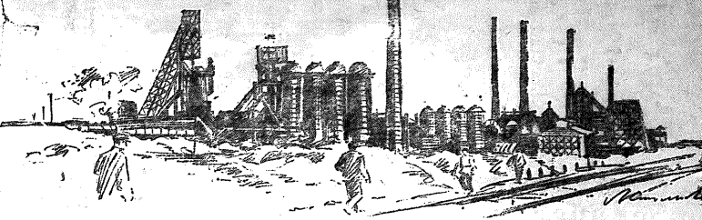
ЗАКОНЧИВАЮТСЯ СТРОИТЕЛЬСТВО НОВОГО МЕТАЛЛУРГИЧЕСКОГО ГИГАНТА — ДРАМАШТОРА. На рис. ПАНОРАМА СТРОИТЕЛЬСТВА.

Вспомогательные бригады в производственном процессе сева. Вспомогательные бригады в производственном процессе сева. Вспомогательные бригады в производственном процессе сева. Вспомогательные бригады в производственном процессе сева. Вспомогательные бригады в производственном процессе сева.