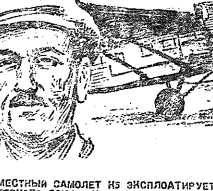
Одномоторный пассажирский 8-местный самолет