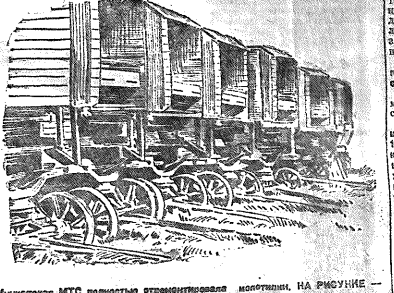
Мужчины МТС полностью ознакомились колхозники. На рисунке — опытные механизаторы моту унарав.