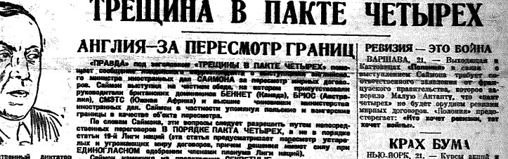
Тиссен — хозяйственный директор Германии