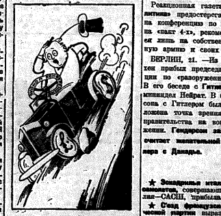
В прострел крама.