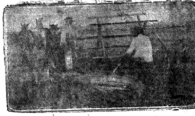
Уборка урожая в бригаде № 2 колхоза «Большевик» (Россошанского района)

Уборка урожая в бригаде № 2 колхоза «Большевик» (Россошанского района). Женщины бригады работают с утра до вечера, собирая урожай в полях. Урожай собирается в корзины, которые затем вывозятся в амбары.