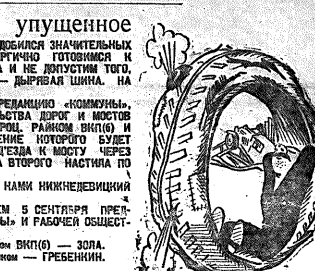
ВЫСТАВКА НА СОВЕРШЕННУЮ СОДЕЯНИЕ С НАМИ НИЖНЕГОРЬСКИЙ РАЙОН.