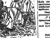
Обязательное питание в поле. Колхозники Кавказской станицы, Поволжья.

Колхозники должны заботиться о своем будущем, о своем доме, о своих детях. Они должны быть уверены в том, что их труд будет вознагражден, что их семья будет обеспечена всем необходимым для жизни.