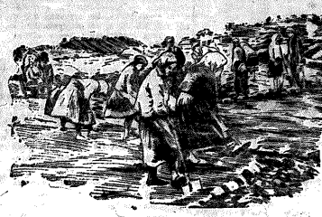
Ремонт дороги, ведущей к Липовому спуску.

В целях лучшего и быстрого выполнения годового плана дорожно-строительного строительства (ВНП) постановили: 1. Провести по области с 25 сентября по 16 октября г. двухдневный сбор бригады за хорошую работу.