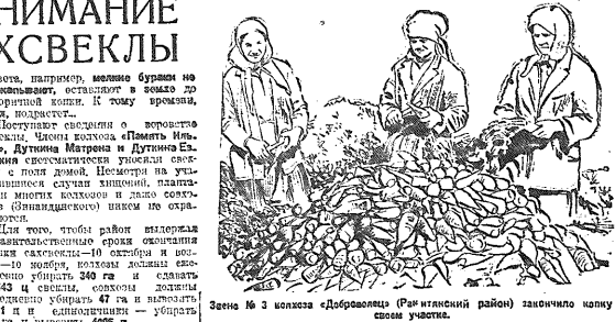
Земляки № 3 колхоза «Доброделье» (Рязанский район) заготавливают сахарную свеклу.

В Рязанском районе сахарозаводы вынуждены два месяца в неделю не получать в полном объеме сырье. В настоящее время в Рязанском районе сахарозаводы получают в среднем 1,5 тонны сырья в сутки. Этого количества недостаточно для полного обеспечения сахарозаводов сырьем. В настоящее время в Рязанском районе сахарозаводы получают в среднем 1,5 тонны сырья в сутки. Этого количества недостаточно для полного обеспечения сахарозаводов сырьем.