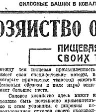
Сильные башины в Новеленовском маслозаводе.

Постановление Обкома ВКП(б) ЦОУ от 19 октября 1933 года. В совхозах ЦОУ, где ведется строительство, в настоящее время работают около 10 тысяч человек. Это строительство ведется в основном в совхозах ЦОУ.