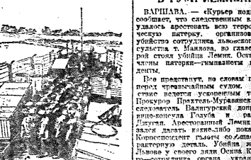
КОНЦЕНТРАЦИОННЫЙ ЛАГЕРЬ НА СУВАНЕ...