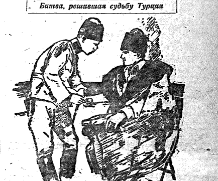
Именитый и именитый в деле битвы на Турции от анти-германской интервенции (С. Сорокинский рисует).