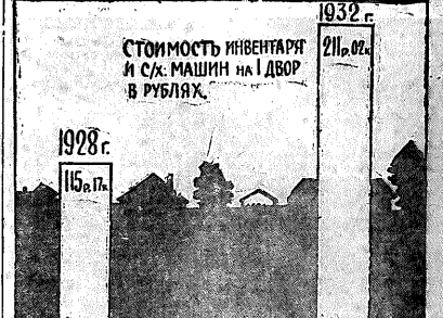
Ушел первый пятилетний ст. инвентаря и с.х. машин на один двор колхозника в 1932 году...