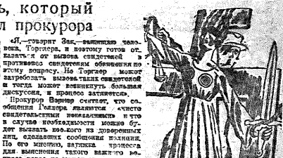
«Лейпцигский Юстиция» (Рисунки выполнены Юрием Сидоровым)