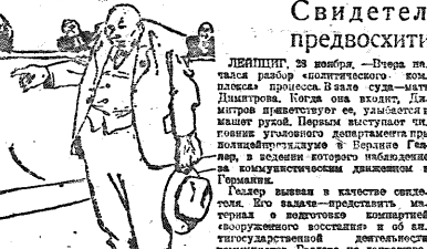
Лейпцигский Юстиция (Рисунки выполнены Юрием Сидоровым)