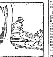
... А ЧТО НЕ БУДЕТ ДАЛЬШЕ?