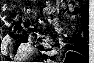
По вечерам в клубе народки — битком, колхозники активно участвуют...

В 1938 году в селе было 16 парков, теперь их 220, не считая обочин.