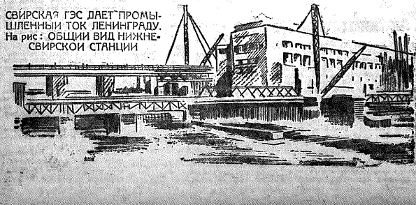
СВЯРСКАЯ ГЭС ДЛЕТ ПРОМЫШЛЕННЫЙ ГОС ЛЕНИНГРАД. На рис. ОБЩИЙ ВИД НИЖНЕ-СВЯРСКОЙ СТАНЦИИ

К IV СЕССИИ ЦИК СОЮЗА ССР VI СОЗЫВА Ввиду того, что сессии ЦИК и ЦИК УССР еще не закончили свои работы, открытие IV сессии Центрального исполнительного комитета Союзного ЦИК VI созыва, назначенного на 28 декабря 1933 г.