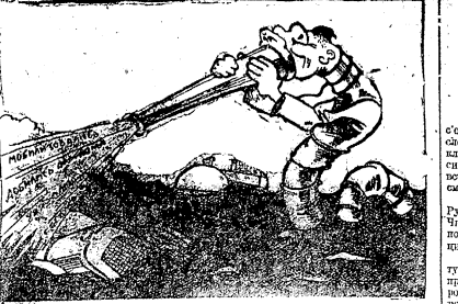
На иллюстрации — тракторист-ремонтник в работе.

В наши дни тракторы являются решающим звеном. Следовательно, необходимо чтобы в каждой районной, заводской и коммунальной мастерской, где производится ремонт тракторов, были бы мастера, способные справиться с этой работой. Только конкретные специалисты могут обеспечить качество и скорость ремонта. Как же в действительности обстоит дело с подготовкой ремонтников тракторной мастерской?