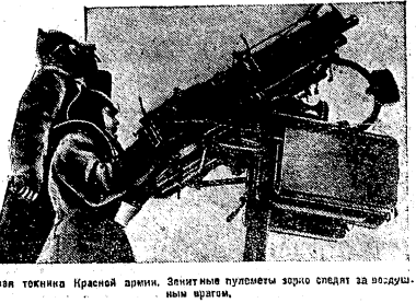
Новая техника Красной армии. Зенитные пулеметы зорко следят за воздушными врагами.

ЛОНДОН 21 — (ТАСС) — Лондонцы приближаются к голодному походу... ГОЛОДНЫЙ ПОХОД НА ЛОНДОН