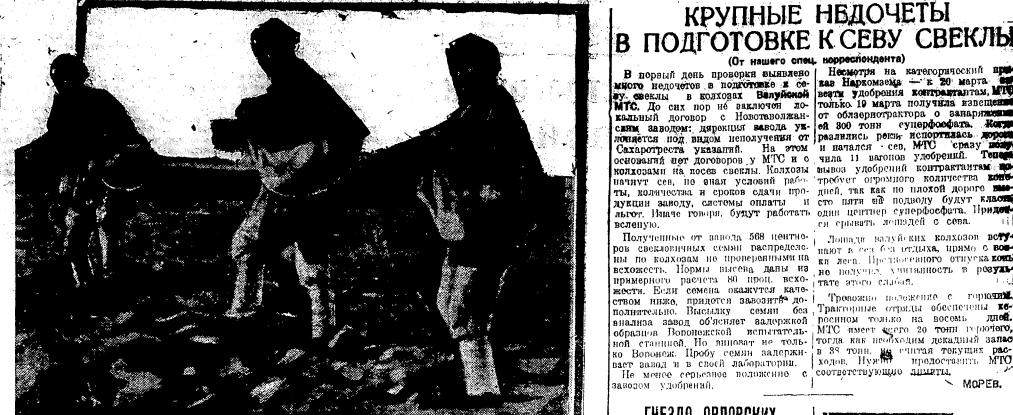
СЕВ В ГРЯЗЬ В КОЛХОЗЕ «ВПЕРЕД К СОЦИАЛИЗМУ», ПОД ГРЕНСКОГО РАЙОНА