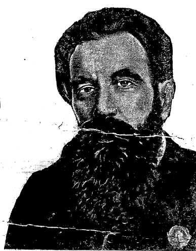
НАЧАЛЬНИК ЭКСПЕДИЦИИ ТОВ. О. Ю. ШМИДТ.

Перелет из Ванкарема в Ном, протяжением 375 миль, был выполнен Слепневым в 2 час. 10 мин.