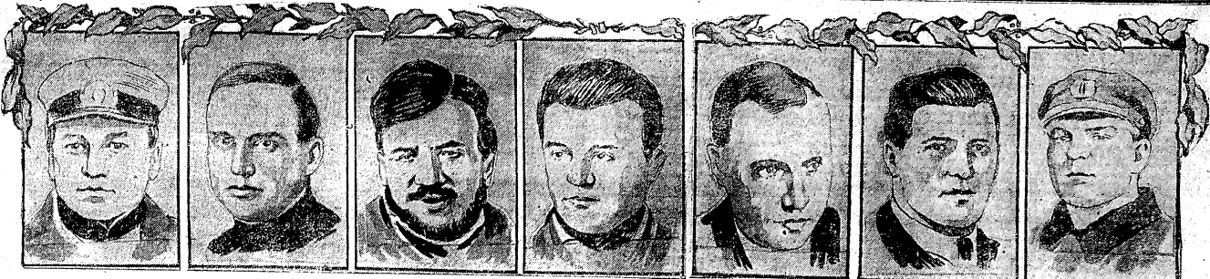
ДОСТОЙНЫЕ СЫНЫ НАШЕЙ ВЕЛИКОЙ РОДИНЫ—ГЕРОИ СОВЕТСКОГО СОЮЗА, СПАСШИЕ ЭКСПЕДИЦИЮ ШМИДТА,—т. ЛЯПИДЕВСКИЙ, ЛЕВАНЕВСКИЙ, МОЛОКОВ, КАМАНИН, СЛЕПНЕВ, ВОДОПЬЯНОВ И ДОРОНИН