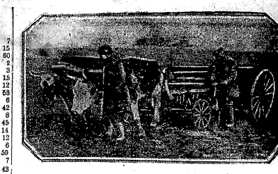
Посев сахарной свеклы в Красносельском сельском колхозе, Рязантинской области