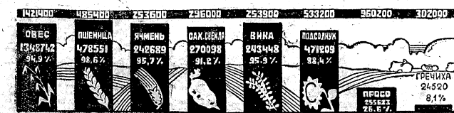
Диаграмма хода сева по культурам на 10 мая 1934 г. Верхняя строка показывает план сева, вторая - количество засеянных гектаров, третья - процент выполнения плана