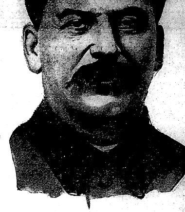
И вместе со всеми мы, счастливые от того, что будем продолжать строительство социализма, от всех ваших героических усилий: «ДА ЗДРАВСТВУЕТ ВЕЛИКИЙ СТАЛИН!»

Завтра мы прибываем в Москву, завтра мы вступаем на землю столицы великой нашей родины. Из льдов Чукотского моря, опасенных стальными льдами, мы пройдем триста миль, и вот с Чукотки, Канчатки, и восточной Сибири мы вступим в Москву. Мы знаем, что ты, тов. СТАЛИН, будешь в числе тех, кто будет руководить нашей партией, кто будет руководить нашей страной, кто будет руководить нашим народом, великим народом, великим народом, великим народом. Мы знаем, что ты, тов. СТАЛИН, будешь в числе тех, кто будет руководить нашей партией, кто будет руководить нашей страной, кто будет руководить нашим народом.