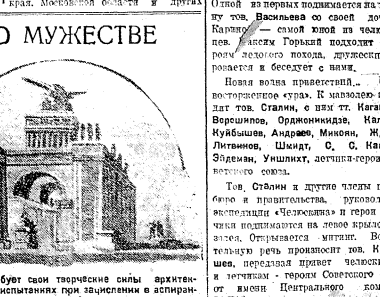
Продолжение статьи с 3-й стр.

В памяти о мужестве. Мужество — это не только сила, это не только смелость, это не только героизм, это не только отвага, это не только храбрость, это не только смелость, это не только героизм, это не только отвага, это не только храбрость, это не только смелость, это не только героизм, это не только отвага, это не только храбрость.