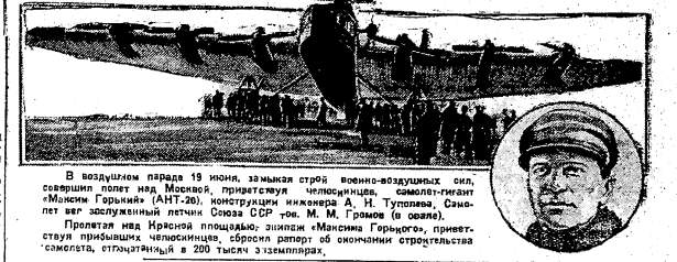
Героям советской страны — славным и мужественным летчикам, неустрашимым исследователям Арктики

Товарищи! Челюскинцы и летчики-герои Советского союза — это герои нашего времени. Они показали нам, что человек способен на великие подвиги. Они показали нам, что наука и техника — это основа нашего прогресса. Мы должны учиться у них и продолжать их дело.