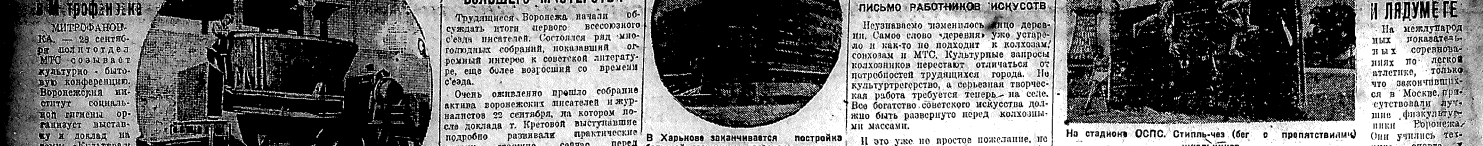
На станциях ОСПС. Глиночича (бег шпальтов) и прелативитов