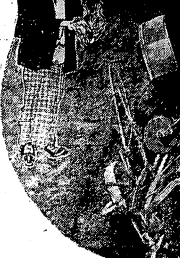
НЕКРАСОВ: СМОТЯТ Я ВАС ПОСОВЕТЫ... КАК НИ В АКТУ ДОНАЛИДНО... НАЙТИ, КОМУ ВОЗВРАТИТЬ ЖИТЬ, СЧАСТЛИВО НА РУСИ.

Богатой жизнью процветают наши производственные районы. Не только страна, но и ее население живут радостно и счастливо. Не только страна, но и ее население живут радостно и счастливо. Не только страна, но и ее население живут радостно и счастливо.