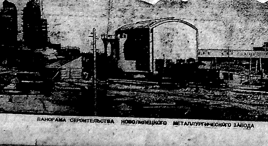
Панорама строительства Новолипецкого металлургического завода

Первое опробование механизмов доменно-го аппарата (на доменной печи) показало высокий уровень качества. Второе опробование аппарата (на доменной печи) показало высокий уровень качества. Второе опробование аппарата (на доменной печи) показало высокий уровень качества. Второе опробование аппарата (на доменной печи) показало высокий уровень качества. Второе опробование аппарата (на доменной печи) показало высокий уровень качества. Второе опробование аппарата (на доменной печи) показало высокий уровень качества.