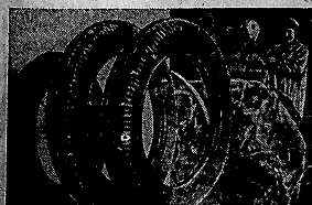
Умно промышленности главного города области...