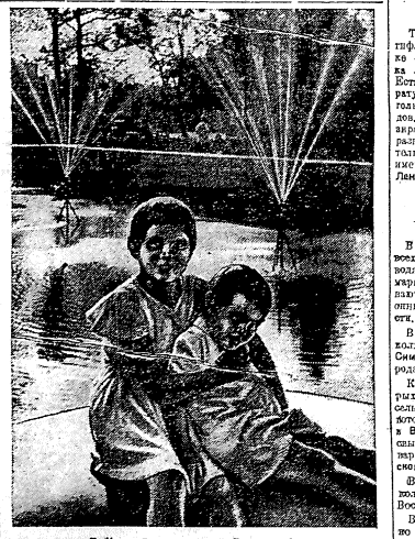
В Кольском озере. Дети у фонтана.