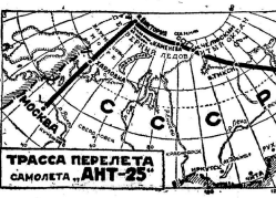
ТРАССА ПЕРЕЛТА САМОЛЕТА „АНТ-25“

Г. ЧКАЛОВ, БАЙДУКОВ И БЕЛЯКОВ—ПОЧЕТНЫЕ ЧЛЕНЫ ЦЕНТРАЛЬНОГО АЭРОКЛУБА МОЛОТОВА