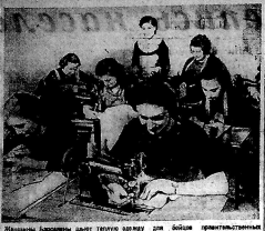
Испанцы наводят свою волю на первый этап войны.