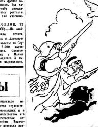
Иллюстрация к рассказу Д.М. Лебедева «В ва очага войны».