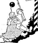
Мельник из див. артиллерии полка воевал в должности шофера. Рис. Евг. П. Пуртович.