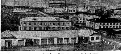
Извест. Ленинград. Железнодорожники в экспедиции на Северный полюс.