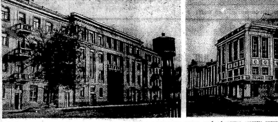
В Воронежской области в 1939 году возросла промышленная продукция, возросло число рабочих, увеличилось производство электроэнергии. На снимке: заводской корпус Воронежского государственного университета имени Г.И. Успенского.

ВАЛОВАЯ ПРОДУКЦИЯ ВОСХОДА В 1939 В Воронежской области в 1939 году валовая продукция составила 1019,0 центов, в 1926 году — 1818,0 центов, в 1927 году — 1202,0 центов, в 1928 году — 608,0 центов, в 1929 году — 313,0 центов.