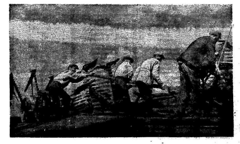
Колхозники Тулунской области, направляя своему волонтеру Коротовскому району, Воронежской области, 35 вагонов подарков: 200 лошадей с упряжью, 500 голов скота, сельскохозяйственным и другим инструментам.

Тулунская и Чаповская области отправили свыше 30 вагонов различных грузов в Воронеж. Тулунская и Чаповская области отправили свыше 30 вагонов различных грузов в Воронеж.