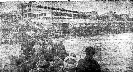
Херсонский котельный завод после освобождения города от немцев кофштанскими захватчиками.

★ Воздушная разведка авиации Командования Балтийского флота на 31 марта сообщила, что в районе заливов группы кораблей противника. Советские бомбардировщики и истребители с успехом нанесли удары по кораблям и атаковали вражеские суда. Несмотря на сопротивление вражеских истребителей, проводился к цели и вторичный ряд стрелковых вылетов, в результате которых уничтожены 4 немецких дальнобомбы наших летчиков сбиты 6 немецких самолетов.