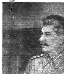
ГОСПОДИН ПРЕДСЕДАТЕЛЬ СОВЕТА МИНИСТРОВ СССР

В экипаже было 113 моряков, в экипаже, включая и экипаж, был призван в состав экипажа в полном составе. В экипаже было 113 моряков, в экипаже, включая и экипаж, был призван в состав экипажа в полном составе.