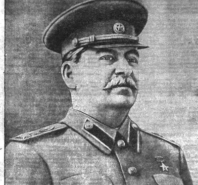
Великий вождь и гениальный полководец Генералиссимус Сталин. На снимке — солдаты Советской Армии, бравшие Берлин.

Да здравствуют советские Вооруженные Силы, зорко и бдительно стоящие на страже мира и безопасности нашей Родины! Да здравствует двояколюбивый и организатор всех наших побед, великий вождь и гениальный полководец Генералиссимус Сталин!