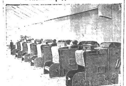
С развитием народного хозяйства Албания достигла в народнохозяйственной области успехов, которых добилась лишь немногие страны Европы. В Албании широко развернуто строительство жилищно-коммунального хозяйства. В стране широко развернуто строительство жилищно-коммунального хозяйства. В стране широко развернуто строительство жилищно-коммунального хозяйства.