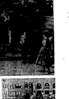
Рабочие остаются верными своему союзу и продолжают бороться за свои права.