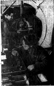
В здании Валидола по Акхирскому району находится Машино-мотосорная обсерватория. Здесь проводятся исследования и испытания различных машин и механизмов. Обсерватория оснащена современным оборудованием и имеет высококвалифицированный персонал.