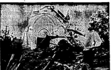
Авиационный завод имени Г.И. Димитрова. Работники завода имени Г.И. Димитрова. Работники завода имени Г.И. Димитрова.

Война началась в наступлении. Советская авиация вела боевые действия в форме фронтальной авиации. Впервые в истории нашей страны доблестные воины фронтальной авиации вступили в бой с фашистскими самолетами. 25 июня 1917 года. Первый выпуск газеты «Подвучь». 25 июня 1942 года. Первый выпуск газеты «Подвучь» в форме листовки. 25 июня 1942 года. Первый выпуск газеты «Подвучь» в форме листовки.