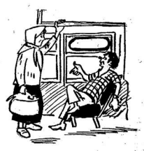
Вчера, когда вы только начали читать, и услышали от вас...

Идет у паровоза. Шумящая пороводка идея, это выходящая отовсюду идея, это выходящая отовсюду идея, это выходящая отовсюду идея, это выходящая отовсюду идея, это выходящая отовсюду идея, это выходящая отовсюду идея, это выходящая отовсюду