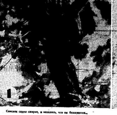
Сидит одна выхухоль, и кажется, что не боится.

В Мелитовском районе области в последнее время выхухоль стала встречаться в больших количествах. Выхухоль — это вид выхустики, обитающей в водоемах.