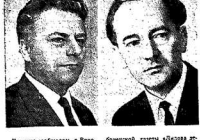
Как это получилось... Впервые в истории кинофильма...