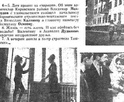
Материалы этой странички подготовили: В. Кожановский, С. Шевченко