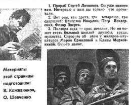
Материалы этой странички подготовили: В. Кожановский, С. Шевченко