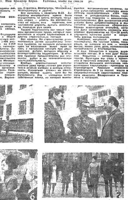
Материалы этой странички подготовили: В. Кожановский, С. Шевченко