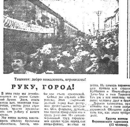
Ташкент! Дай руку помощи, городишка!