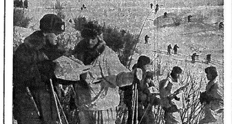
Разведка идет вперед наступления.

Война в селе Памятнык была очень тяжелой. Жители села были вынуждены бороться за свою жизнь. Они были окружены немецкими войсками. Они были вынуждены бороться за свою жизнь. Они были вынуждены бороться за свою жизнь.