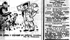
Иллюстрация к статье «Тайна будущего моря»

Море — это тайна, которую хочется разгадать. Оно бесконечно и загадочно. Каждый, кто стоит у воды, чувствует ее мощь и красоту.