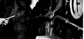
Этот человек... К. Огурцов...