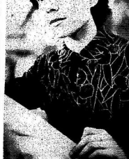
«Ветеран» — в колхозе «Колос» — такая женщина активно участвует в выполнении плана.

В колхозе «Колос» работники активно участвуют в выполнении плана. В колхозе «Колос» работники активно участвуют в выполнении плана. В колхозе «Колос» работники активно участвуют в выполнении плана.