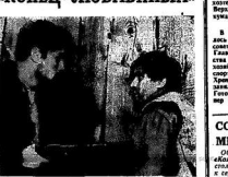
Кадр из фильма «Конец любовных».

Ф ИЛЬМ «КОНЕЦ ЛЮБОВИНЫХ» рассказывает о жизни и подвиге героя. Фильм рассказывает о жизни и подвиге героя.