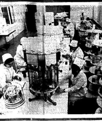
Учащиеся в классе.

В СССР за последние годы созданы десятки аптечных исследовательских центров. Эти центры занимаются изучением новых лекарственных препаратов, их свойств, эффективности и безопасности. В СССР за последние годы созданы десятки аптечных исследовательских центров.