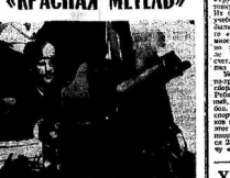
Кадр из фильма «Красная метель».

В ТЕЛЕВИДЕНИИ показана картина «Красная метель». Картина рассказывает о жизни и подвиге героя. Картина рассказывает о жизни и подвиге героя.