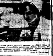
На фото слева — участник конкурса рационализаторов, справа — организатор конкурса.

Важно в этом процессе участие самих командиров. Они должны быть активными участниками учебного процесса. Для этого необходимо создать условия, при которых командир может свободно высказать свое мнение, предложить свои решения.