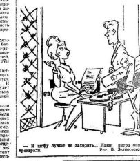
В нашу футбольную команду. Имя героя - Александр...