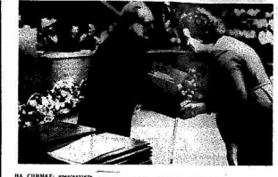
НА СНИМКЕ: международная делегация и члены олимпийского комитета

Спортивная делегация из Украины... Олимпийские игры... Международный олимпийский комитет... Организационный комитет... Участники XX Олимпийских игр