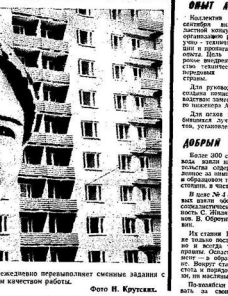
Они качественно производят сложную продукцию с отличными характеристиками.